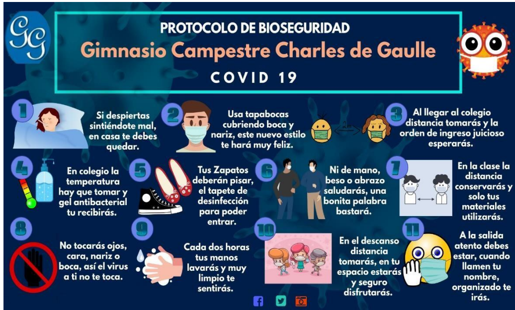
Resumen didáctico del protocolo de bioseguridad para los estudiantes al ingreso del colegio.